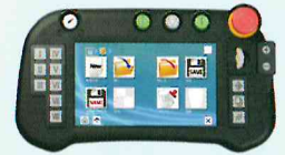
タッチパネルと3D表示で より使い易くなった ティーチングペンダント